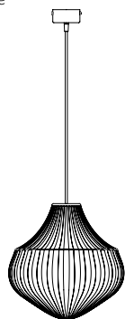
SE258 AB INT